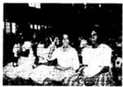
世界は一つ みんなファミリー