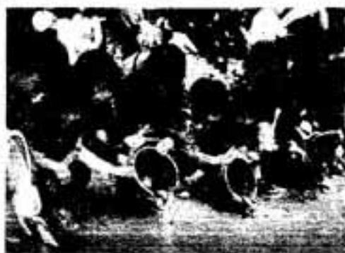
「早く大きくなってね」

白水大池公園で、3月12日に白水保育所の子どもたちが参加して、約2千匹のコイの稚魚を放流しました。 子どもたちは、バケツの中でピチピチはねるコイを次々に池に流し込んで大喜び。 そして、浅瀬に放たれて池の深みに姿を消していく稚魚を、最後まで見送っていました。 現在は約10センチほどのコイも、5年もすれば大きなもので約70〜80センチの大きさになるそうです。元気に育てばいいですね。