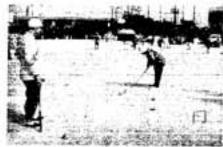
何をすることも健康が一番

・文芸コース 30人 ・歴史コース 35人 ・健康コース 35人 ※ 教費、選択講座とも受講