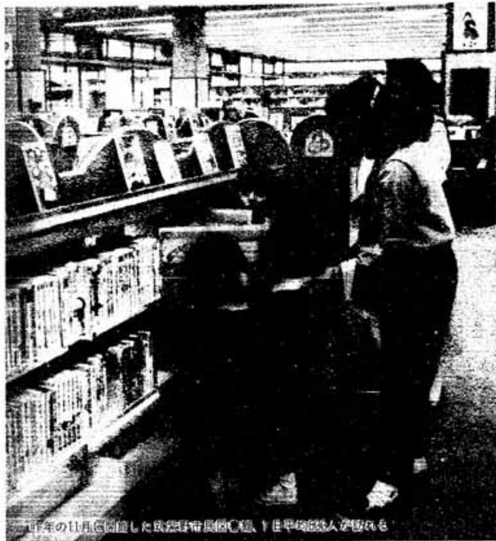
昨年の11月、開館した成徳野帯風園心館、1日平均約30人が訪れる