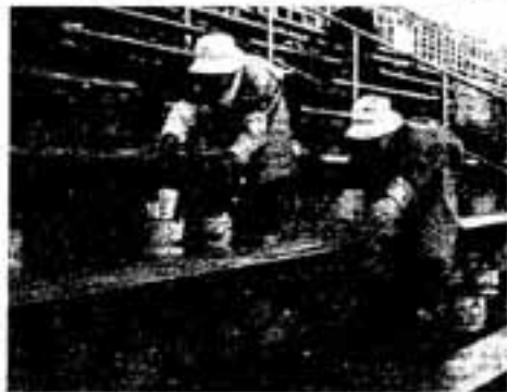
ボランティアの市民が支えたとびうめ国体