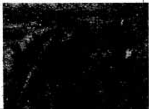
日本初の完全な銅鏡鑄型が出土

ところの「工業団地」を形成していたと思われる。原料供給や流通などの面で強大な組織がなければ、工房を維持することはできないので、背後に大きな統制力を持った人や組織の存在を想像することができると語っていました。