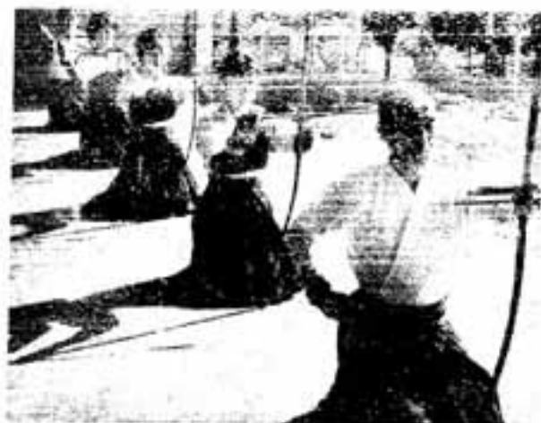
緊張感に満ちた礼射