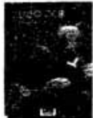
松岡享子訳 イーラ作 二ひきのこぐま

「日本人をやめる」とは、さまざまな社会について、自己が持つステレオタイプを総点検し、越境人間を目指す事です。自らを越境人間とする著者が、歯切れよく国際比較論を展開しています。