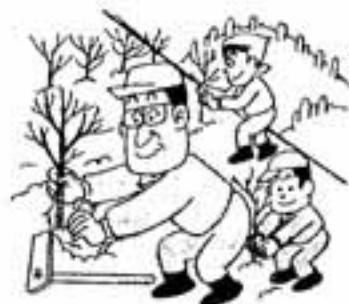
国土緑化推進期間 (3月1日～5月31日)