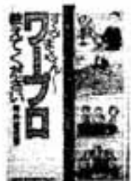
坪井達夫著 ワープロ教えてください はいません！

京都を出発し、ヨーロッパ、アフリカの都市を旅し、点状にする建築物から都市構造を考察し、読者の前に「空間」を演出している楽しい本です。