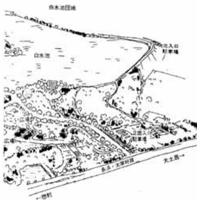
白水大池公園見取り図