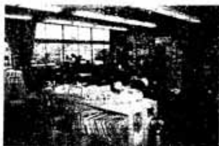
皆さん、本よんでいますか？

どもたちの活字離れが心配されています。もつと、読書の良さを知ってもらうために、読書講演会を開きます。皆さんも、読書について考えてみませんか。