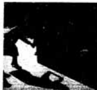
火災 こわいですねー

この時期は、火災が発生しやすい気候です。火の元には十分注意し、特に次の7つの点に気を付けましょう。 1 寝タバコやタバコの投げ捨てをしない 2 子どもがマッチやライターで遊ばないようにする 3 風の強いときはたき火をしない 4 天ぷらを揚げるときはその