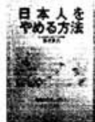
杉本良夫著 日本人をやめる方法

本書では、特に、OA機器と縁が薄いと感じられている、中高年の人たちにむけて、親しみやすく明解なワープロの使用法、可能性が紹介されています。