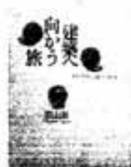
若山 滋著 建築へ向かう旅

京都を出発し、ヨーロッパ、アフリカの都市を旅し、点状にする建築物から都市構造を考察し、読者の前に「空間」を演出している楽しい本です。