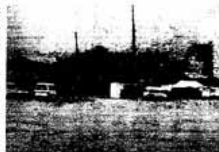
麓々と工事が進む春日野小学校