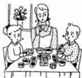
お宅のみそ汁 辛くありませんか？