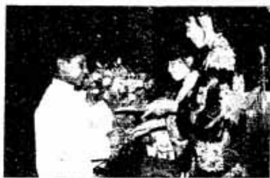
こんにちは ようこそ春日市へ