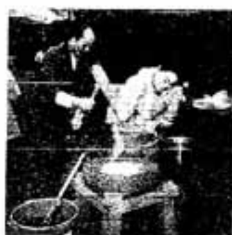
こりゃうまそうだ