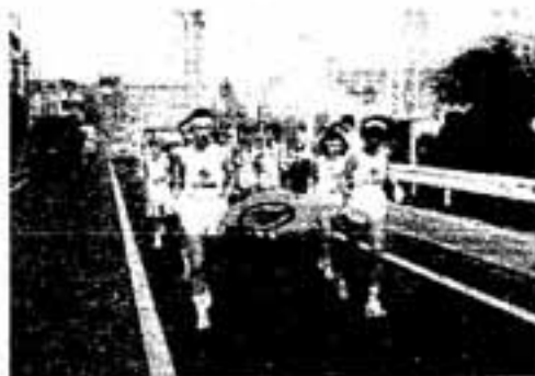
一生の思い出になります

会場と炬火」を春日公園で大野城市から本市に引き継ぎ、市内10区間をリレーしました。