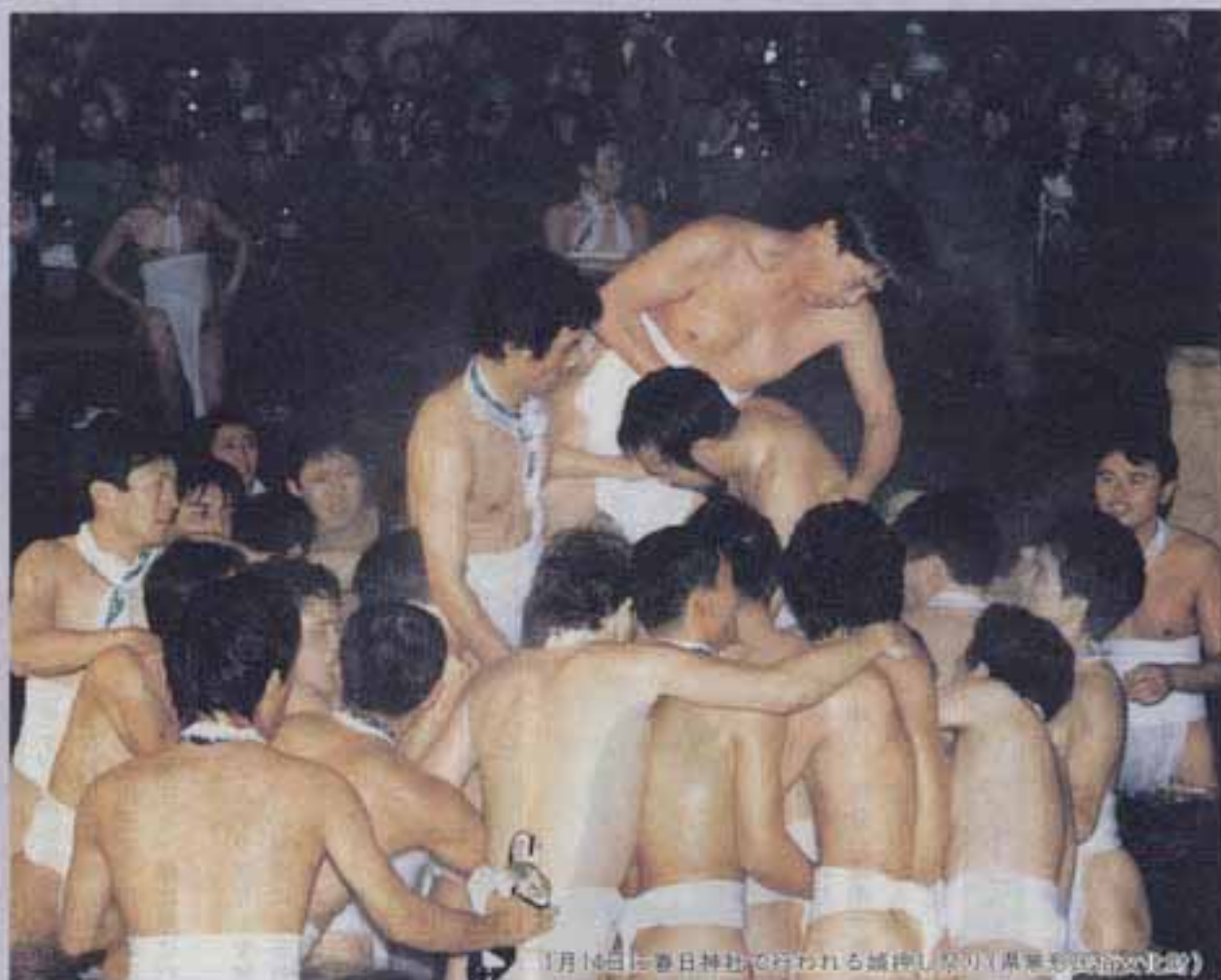
1月14日に春日神社で行われる城神し祭り(県民も参加可能)