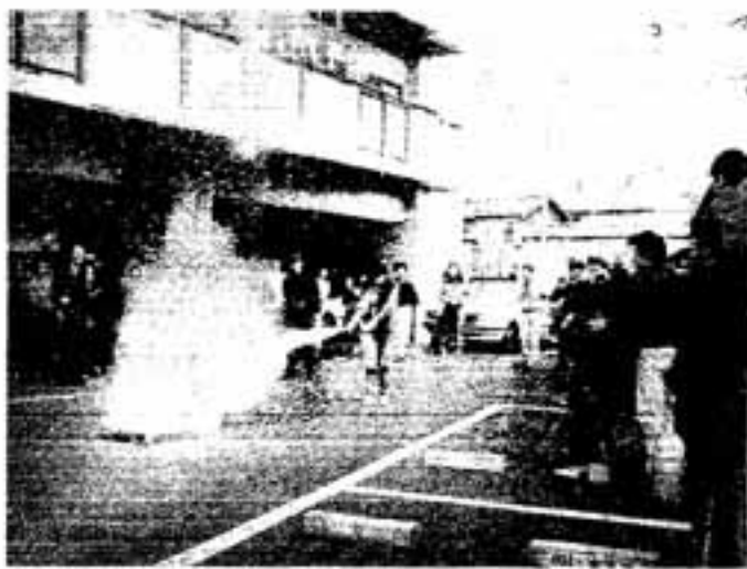
消火器の操作も体験

訓練に参加したマンションの人々は、消防署からの消火器の操作、避難の方法、日頃の防災体制の大切さなどの話に、真剣に耳を傾けていました。