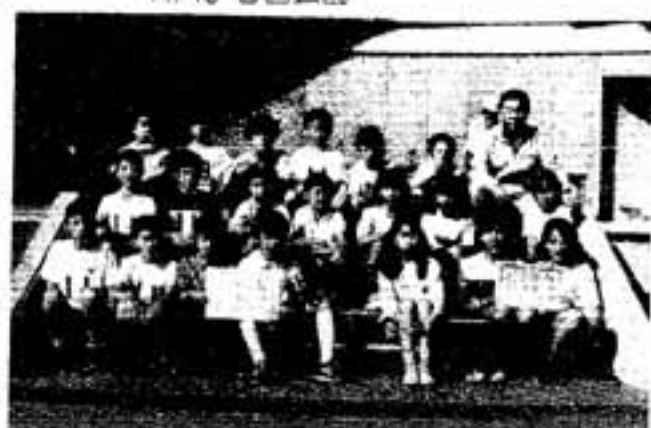
1-2位を占めた若葉東子ども会