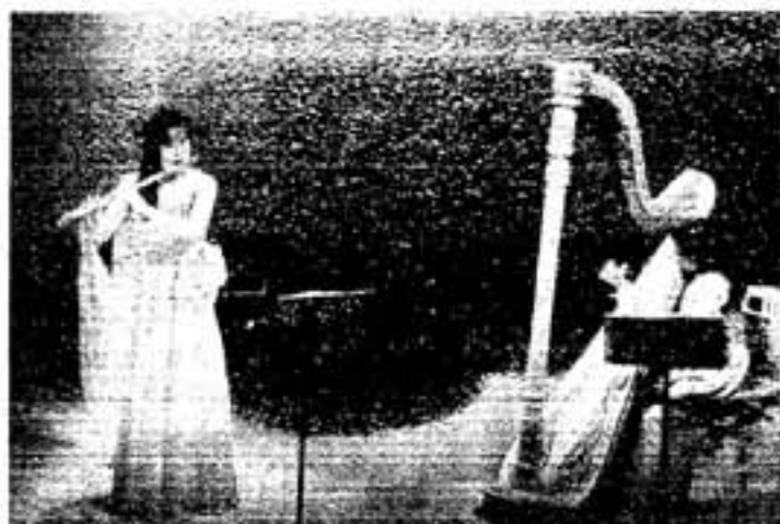
フルートとハーブの柔らかい音色が聴衆を魅了