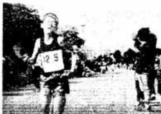
苦痛をこらえながら力走

タコあげのシーズンです。お父さん、お母さんにお願いをします。電線の近くでは、タコを絶対あげないように、お子さんへご注意ください。 もし、電線にタコがかかったら、危険ですから最急の九州電力営業所へご連絡ください。 ●電柱に登って取るのはやめましょう。 ●電線を竹ざおなどでつづくのは大変危険です。 九州電気保安協会