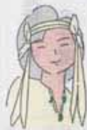
まもづ(リイメーシキ+ラクター 物産ちゃん

総人口 88,802人 男 43,868人 女 44,904人 前月比 +153人 前年同月比 +2,407人 世帯数 30,839世帯 (12月1日現在)