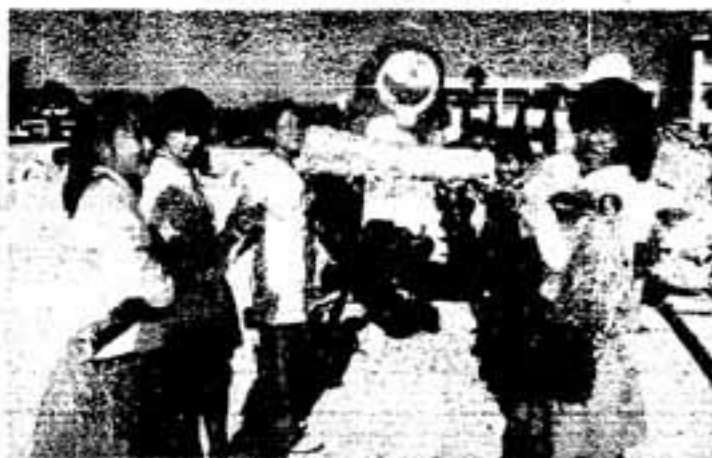
本物にそっくりなドラえもんみこし

大谷小学校で、11月17日谷っ子まつりが開かれました。大谷小学校の開校を記念する祭りとして毎年行われ、今年で12回目になります。