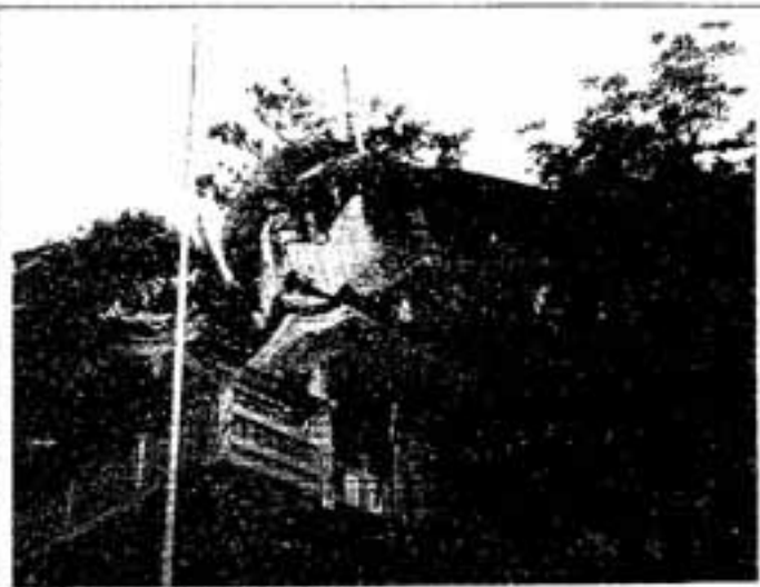
新宮市・神倉山のゴトビキ岩

後ろにナギが、那智大社では、宮家お手植えのナギがありましたし、御袋の図柄は、ナギとカラスでした。この熊野は、古代から「大和」とは異質な独特な地域として見られてきました。クマノとは、隈、陰(かげ)を意味し、原生林の多い神話の里として、さまざまなイメージを形成してきました。