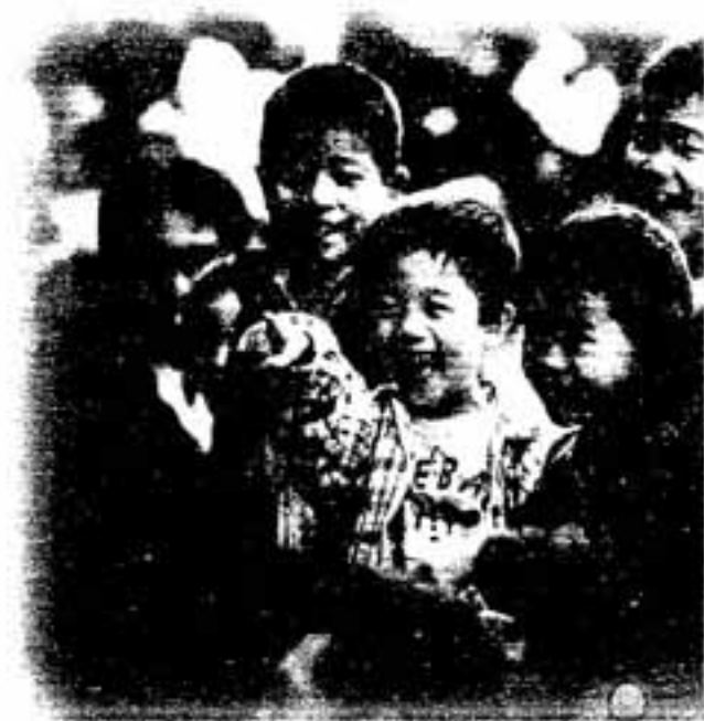
▲みんなの笑顔がみられる社会をめざして