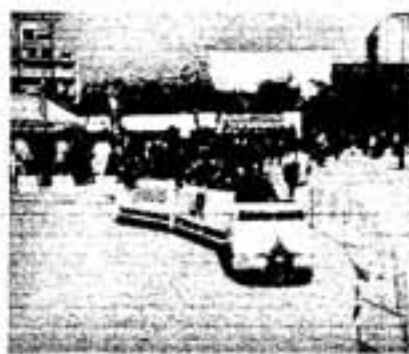
子どもたちに好評だったミニ新幹線

11月8日に春日公園で、春日市走ろう大会が行われました。大会には、小学生から一般男女まで120人が参加、千5百mから5kmを走る個人の部と、6人がリレーする駅伝の部で日ごろ鍛えた健脚を競いました。