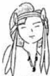
まちづくりイメージキャラクター ゆきちゃん

総人口 92,925人 男 46,133人 女 46,792人 世帯数 33,094世帯 (10月15日現在)