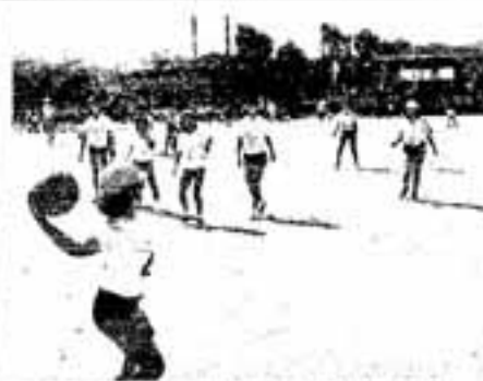
昭和30年代は子ども会活動などが中心

ボランティアという言葉が一般市民が耳にするようになったのは、昭和40年代の中ころです。