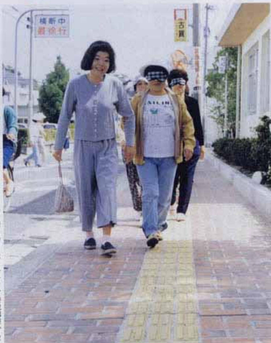
▶アイマスクをつけ街を歩くボランティア養成講座から

20才のステップ、21世紀ヘジャンプ。 KASUGA CITY 20th Anniversary 春日市制20周年