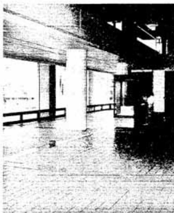
▲市民のいこいの場として開放される市民ラウンジ