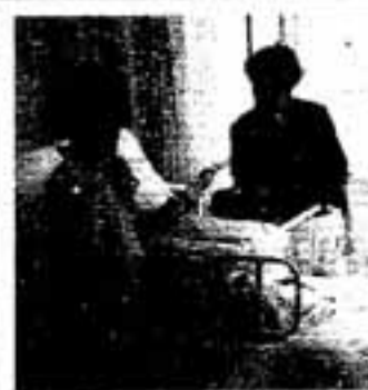
▲お年寄りとの会話も大切

な老後は望めないと思います。そこで、私たちグループで何かできることはないかと話し合