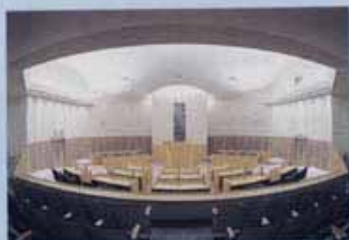
市民に直結した議会を目指し、1階に設けた議場には、市民ホールから直接傍聴席へ入れます。

「感性発信都市・かすが」の街づくり拠点として、建設を進めていた新市庁舎がこのほど完成しました。新庁舎は、米軍春日原基地跡地（原町3丁目1番地の5）の約3万㎡の敷地に地下1階地上6階建ての行政棟と2階建ての議会棟、大会議棟で、延べ床面積は現庁舎の約2.5倍の約1万4900㎡。すぐ南に隣接する春日公園と一体化した「公園庁舎」を売り物に、訪れた市民が憩いの場として利用できるよう工夫がこらされています。