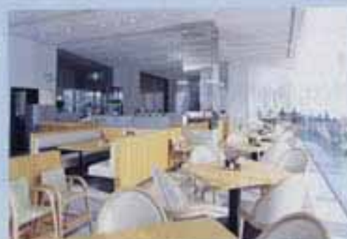
大会議棟1階のレストラン、ファーストフード店は、職員厚生施設として、また、市民の方々の語らいの場、集いの場として、ご来店をお待ちしています。

【営業時間】 ファーストフード店 9:00～22:00 レストラン 10:00～22:00