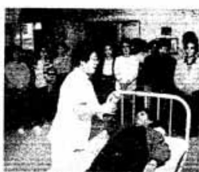
▲老人介護の訓練(ボランティア養成講座)

ボランティア活動は、共に活動するなかで、苦しいことつらいことを共に楽しみに転化し分かちあう、すばらしいおもしろ味のある活動です。決して構える必要もありません。最初の動機にこだわらなくても構いません。充実した生きる手応えをつくるという面からも、ぜひあなたも参加してみませんか。