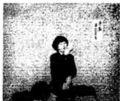
▲講演会での手話通訳

しかし、ボランティア活動とは自己充実や仲間づくりにとどまらず、さらにもう一歩、社会参加への志向、地域社会づくりへの志向までを踏まえた取り組みです。だからこそ、現代社会の課題を解決していくものとして必然的にボランティア活動が必要とされる社会になってきたわけです。ボランティア活動は、市民という立場から地域社会づくりの取り組みを進めようとする民間活動であり市民運動であるのです。