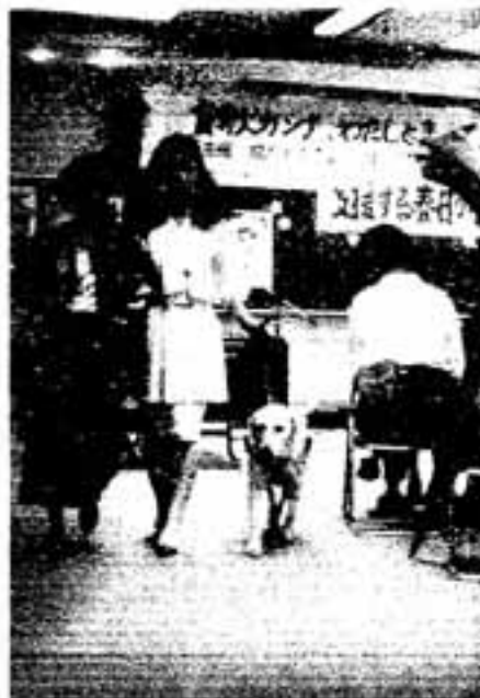
▲会場には盲導犬カンナの姿も

全盲の女性と盲導犬が5キロのロードレースを完走した実話の映画化を応援しようとして、盲導犬カンナ、わたしと走ってノナ、わたしと走ってノ