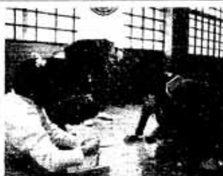
▲子どもたちとスゴロク遊び

当面、すぐにできるところから実行していこうと考え、ドリムひろうせん(義務教育を終