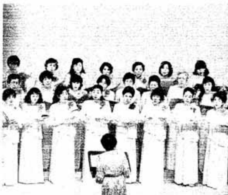
▲仲間づくりのため各種サークルに所属する人も多い

ボランティア活動の必要性が叫ばれるようになった要因のひとつとして、現代社会の大きな変化があげられます。職場、家庭などで機械化、合理化、画一化現象が進むにつれ、仕事の中で生きがいを感じたり、自己の主体性や創造性を発揮する機会が少なくなっています。このよ