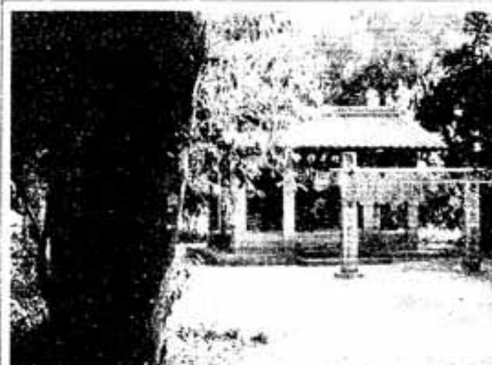
▲住吉神社のナギの林

福岡といえ、ここもナギが「町の木」になっていますが、ここの舍利蔵「勝宝寺」のナギ（県天然記念物）は原始林的フンイキがあつて、高さ32メートルの大樹が立つ立っています。説明板が三つも