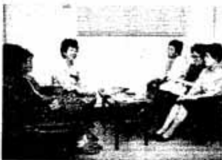
▲妻の会のメンバーの皆さん