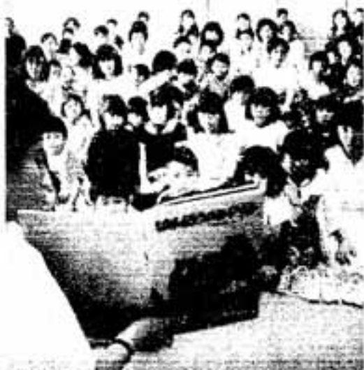
▲話に聞き入る子どもたち