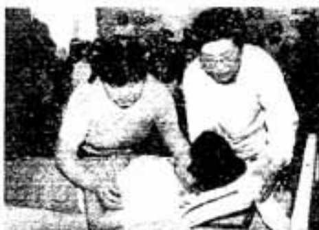
▲関心の高かった看護教室

親と子の読書会連絡協議会は、本を通して家族のきずなを深めようと活動している地区文庫が集まった団体で、毎年講演会、野外活動などを行っています。「おはなしほけつと」では、絵本の読み聞かせのほかに、エプロンのポケットから人形を取り出してジャックと豆の木の話を開かせるエプロンシアター、黒板に絵を貼り付け、歌でカラーの作り方を説明するパネルシアターなど、各地区文庫が趣向をこらした、物語の楽しみ方を披露。会場につめかけた約200人の親子は、一味違った読み聞かせに目を輝かせて聞き入っていました。