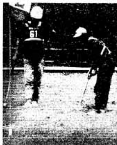
「負けてからも楽しい」

このほかに「ウエストが細くなる話」や「ふれあいバザー」など楽しい催しがいっぱいです。 10月10日は、家族そろって市スポーツセンターに全員集合!