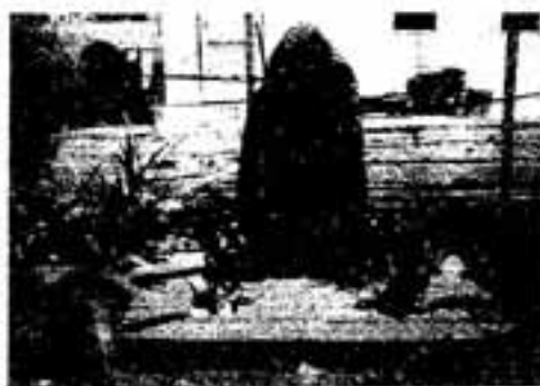
▲江戸時代には数多くの石造物が造られた

るようです。 しかし、事実は少し異なるようです。当時、国民のほとんどは農民でした。農民は当然維新政府が年貢を軽減してくれるものと考えました。ところが維新政府は農民の期待とは反対のことをしたようです。