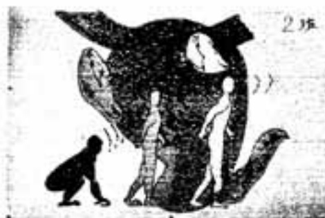
平成4年度新採用職員が描いたイメージポスター

■試験区分・採用予定人員 一般事務A(4人程度)、一般事務B(2人程度)、建築(1人)、土木(1人)、司書(1人)、保健婦(1人)、保母(1人)