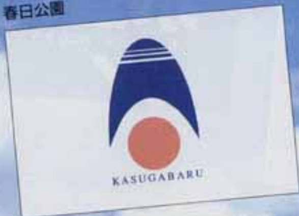
春 日 原