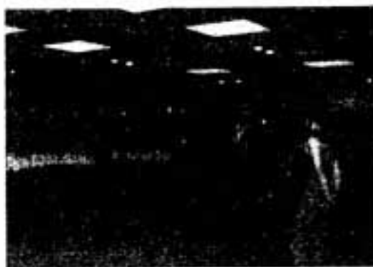
6月10日から市文化会館で、市民創作ミュージカル「奴国伝説」の練習が始まりました。

「稽古場は開放していますので、興味のある人はぜひ市の文化会館に見に来てほしいですね。市民ぐるみのミュージカルにしたいので、見学は大歓迎です。エアロビクスや詩吟の特技なども生かせるのがミュージカル。皆さんの隠れた才能を、市民創作ミュージカルのなかで発揮してみませんか。