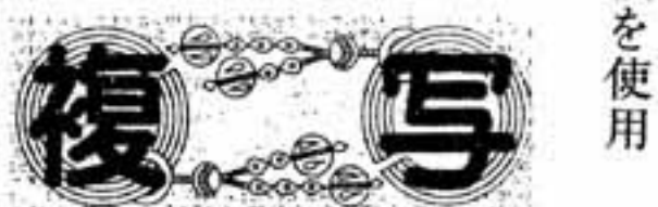
▲コピーすると複写の文字が出ます

市では、8月1日から印かん証明書などの証明用紙を、コピーすると「複写」の文字が出る特殊用紙に切り替えます。これは、カラーコピー機を使った証明書の偽造を防ぐために行うものです。