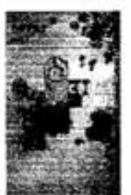
ごきげんな裏階段 佐藤多佳子

どんなネコにも秘密があるっていうけど、うちのごろすけにはないと思う。だって本当になまくらさんなんだもの。自由かってに生きている、たのしいなまくらネコのゆかいなおはなしです。