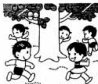
自然に親しむ運動 (7月1日～8月20日)