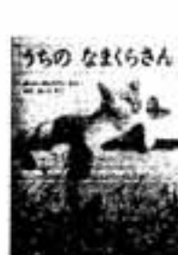
うちのなまくらさん ポール・ジェラティ

リクルート、共和、佐川急便……相次ぐ騒動事件。高まる一方の政治不信のなかで、政治生命を賭けて政治改革・選挙制度改革に執念を燃やす自民党若手議員と党内の権力闘争を活写。