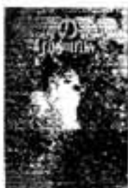
双頭の悪魔 有栖川有栖

西国山中の腐村に作られた芸術家村。その村にある迷宮のような大鐘乳洞で、村のリゾート開発を阻んでいた画家が奇妙な死を遂げる。 英都大学推理研究員が難事件に挑戦する。