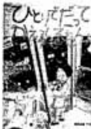
ひとりだってかえれるもん 篠原 良隆

アンタミア標準暦4759年、通貨統合と恒久平和の達成にアンタミア星域中が歓喜にわくなか、一隻の星間連絡船が無人の惑星に墜着した。 銀河宇宙を舞台にしたファンタジー。