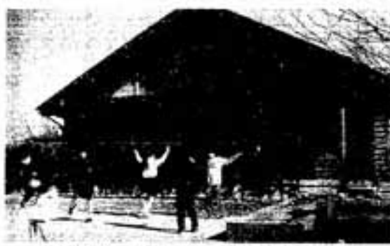
昨年度に作られた春日南小学校児童クラブ舎

ていくことができる、「地域ボランティア」を育成していきます。今後の健康づくりは、健康診断などの活動を主体とした早期発見、早期治療とともに、市民一人ひとりに適応した栄養摂取と運動の方法を指導し、市民各自が自らの健康を管理する能力を高めていくことが必要です。