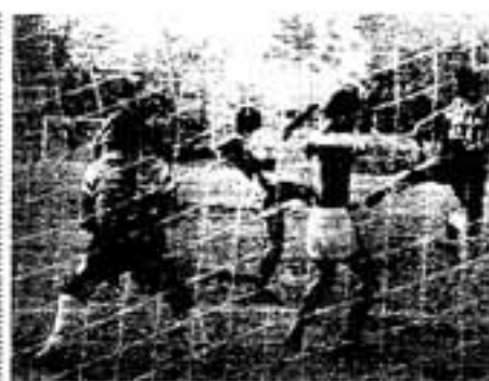
ゴール前の息づまる攻防