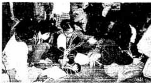
「できたらどこに飾ろうかな」