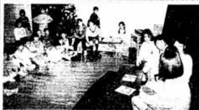
なんでもデキダンの劇「4年目のクリスマス」

12月25日に光町児童館でクリスマス会が開かれました。会には50人の子どもたちが参加し、歌やゲームなどで楽しい1日をお楽しみしました。