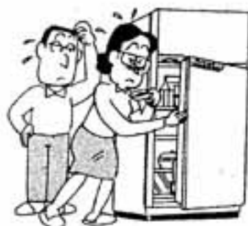
食品衛生週間 (8月2～8日)