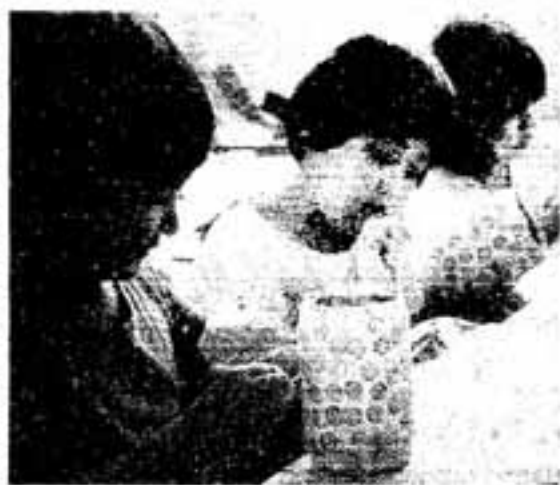
△お父さん喜んでくれるかな

「父の日に手作りのプレゼントを贈ろう」と6月19日に児童センターでプレゼント作りが行われました。