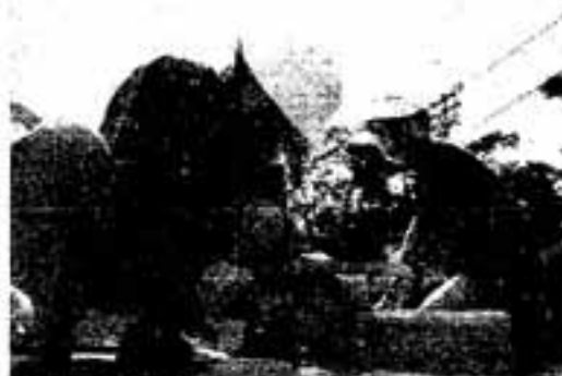
△しっかりおさえておいてね

このスクールでは、第2回目は9月12日に「草木染め」、3回目は3月6日に「外国料理」を行う予定になっています。