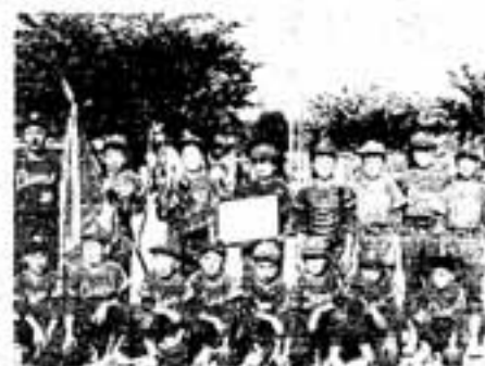
△大土居スポーツ少年団のメンバー

5月23日に春日南小学校と天神山小学校を会場に、春日市スポーツ少年団ソフトボールーナメント大会が開かれました。大会には、市内から16チームが参加。チームワークで接戦を制した大土居スポーツ少年団が優勝を飾りました。