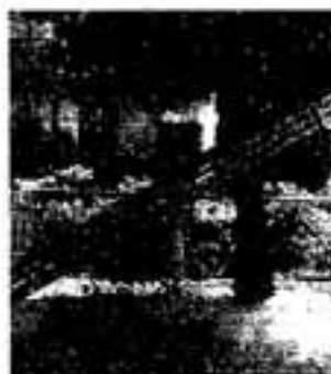
ソウシジュとシャヤンボ(清り白下)

◇「カナリーヤシ」(別名フェニックス)→常緑小高木。高さ20m、葉6mまでのびる。果実は約3cmの楕円形。カナリー諸島