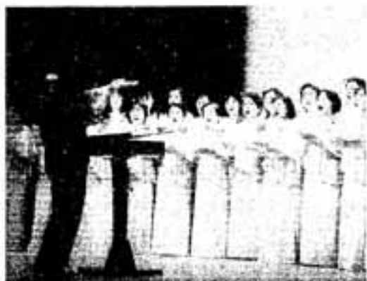
▲88.4%が生涯学習の必要性を感じている

市教育委員会が、 「まちづくりは人づくり」 をテーマに、生涯学習に関する市民アンケートを実施した。このほど報告書の形でもまとめた。