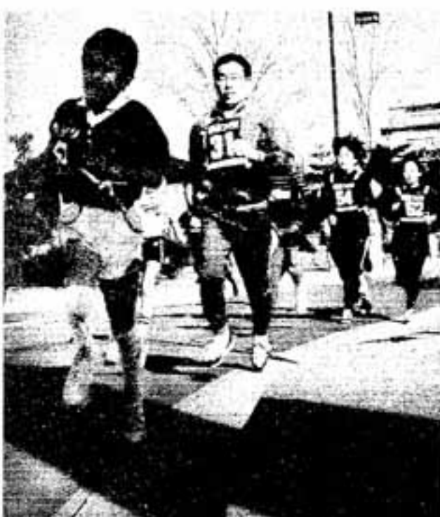
▲地域とのふれあいの場をつくる持久走大会