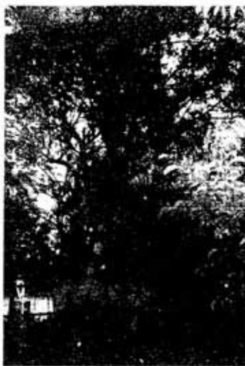
△中央公民館のナギ