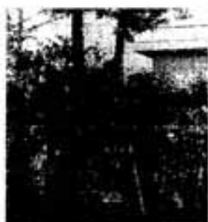
△春日原小学校のナギ

苑の名のとおり、ナギが数多く植えられています。歴史が浅いせいか、若木や苗木が多く、「若い春日市」を象徴しているかのようです。