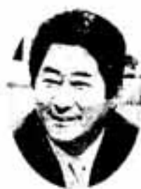
江森 陽弘 氏

講師の江森陽弘氏は、テレビ朝日「モーニングショー」のメインキャスターとして人気のジャーナリスト。