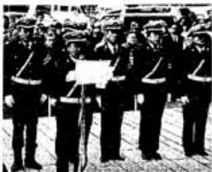
一掃めざしパレード