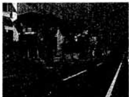
△あなたの固定資産の確認を