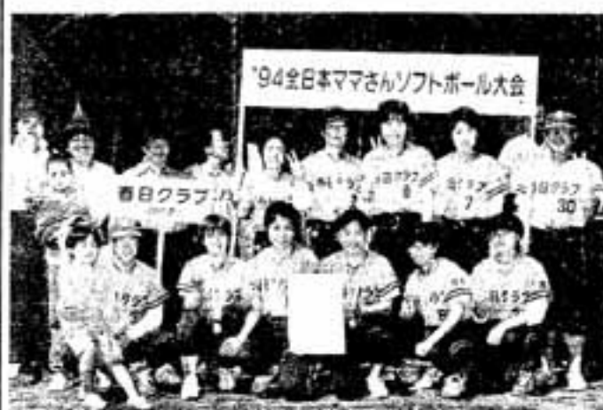
△堂々3位にVサインの春日クラブの皆さん

春日クラブは、昭和58年に栄監督の呼びかけで結成。メンバーは、中学・高校時代にソフトボールの経験のある20代から40代の主婦ばかり。週に2回、家事の合間に2〜4時間の猛練習を続けています。攻守守三拍子そろったいいチームですが、特に堅い守りが売り物です。