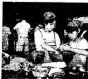
△真剣な表情で料理作り

昼食後は大正琴の演奏、ゲームなどを楽しむなど、3世代のチームワークで、高齢者の明るい笑顔の絶えない楽しい交流になりました。