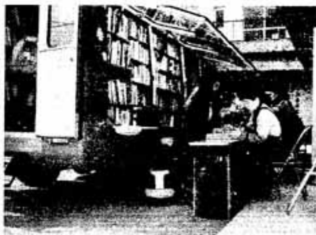
▷移動図書館車たんぼ号