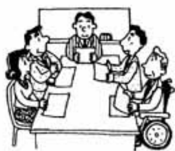
障害者雇用促進月間

239)に9月30日まで提出してください 問い合わせ先 全国身体障害者総合福祉センター・全国コンテスト事務局(〒100東京都新宿区戸山1-22-1、☎03-3204-3611、FAX03-3232-3621)