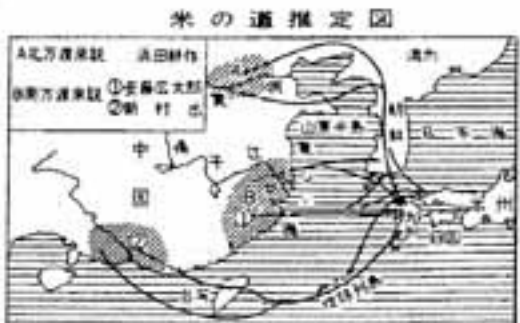
△山川出版社「弥生文化」より

を整え、古代国家形成へ の一步を踏み出します。 そして、列島に孤立し ていた日本民族は東アジ アの国際社会と接触し、 中国文化の恩恵を受け、 文字を始めとする諸々の 文化要素を学ぶことにな ります。 古代の日本の歴史を知 るためには、まずは中国 の史書を繙かねばなりま せん。 郷土史研究会 黒木康友