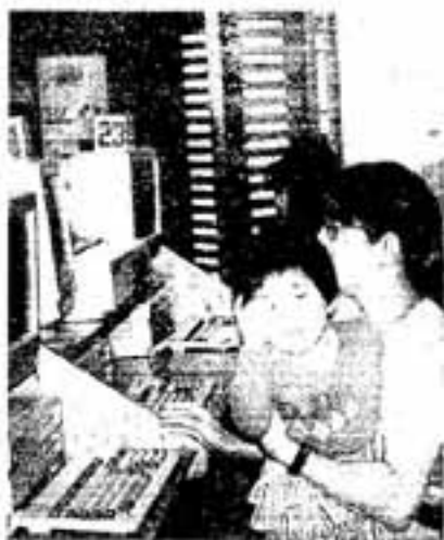
△ちよっと待ってね、もう少しよ。

親と子の読書会では、市にある「ピノキオスクール」6月19日、読書会のメンバー約40人で、日田 土細工を体験しました。