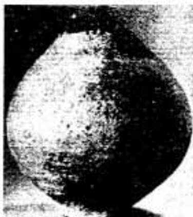
弥生町出土の弥生式土器