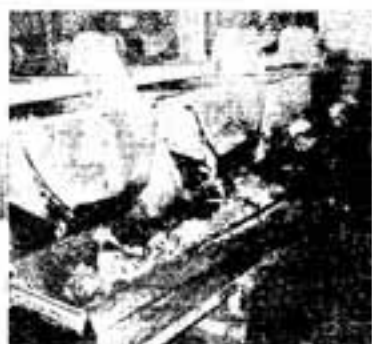
2. 第一選別コンベヤー 集められたゴミの中から燃えるゴミを取り除きます。スプレー缶や電気製品などもここで選別されます。