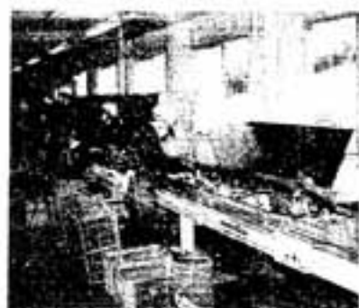
5. 選別コンベヤー アルミ缶、ビン類が選別 されます。ビンは、色別に 選別され、カレット置き場 へと運ばれます。