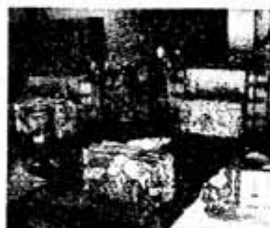
4. あき缶プレス機 スチール缶、アルミ缶は この機械で、四角いプロッ クにプレスされます。