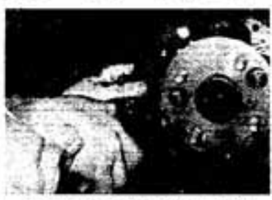
ブレーキの分解点検 (定期点検)