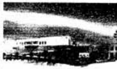
△リサイクルプラザ完成予想図

施設は、鉄骨造りの工場棟（約6千平方メートル）とプラザ棟（2階建て、千2百平方メートル）で構成。平成7年3月完成の予定です。