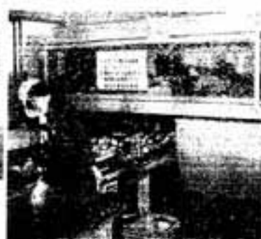
3. 磁選機 スチール缶や鉄くずなどは、この 機械で選別されます。