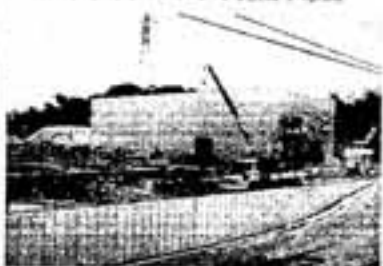
△建設中のリサイクルプラザ

工場棟には粗大ゴミや不燃ゴミの破砕処理施設や、鉄、アルミ、可燃物、不燃物の4種類に分けるための各種選別機、アルミ圧縮機などの再生設備を備えます。また、プラザ棟には、電化製品や自転車、タンスなどの修理、再生をする市民工房を始め、再生品の展示や販売、情報提供などの施設を備えます。