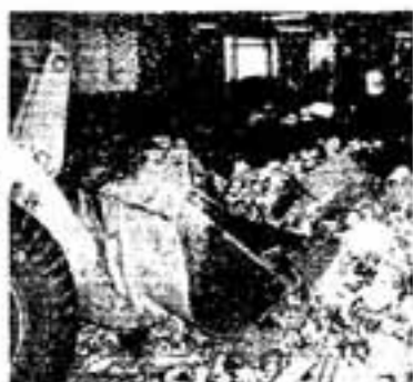
1. 押し込みコンベヤー 春日市と大野城市からでた燃えないゴミは、すべてここに集められます。