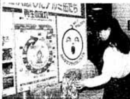
▲回収したアルミ缶は地金に生まれ変わる

を出すなどの方法を講じました。また、コンポスト(生ゴミ堆肥化容器)の購入に助成金を出すなど、さまざまな努力をしてきました。 しかし、ただやみくもにゴミの量を減らせればよいというわけではありません。出されたゴミをリサイクルし、限りある資源を有効活用するシステムがなければ、本当のゴミ問題の解決にはならないのです。 このため、市では大野城市と協力して春日大野城資源回収センターをつくり、不燃ゴミの中から資源の選別を行ってききました。この資源選別に大きな役割を果たしているのが、昭和58年から導入された「不燃ゴミの指定袋」なのです。