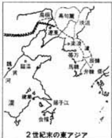
2世紀末の東アジア

韓人の後漢帝への朝貢は、奴国王が使節を洛陽に派遣朝貢した十三年前です。九州の一土豪に金印の授与というのは、韓人