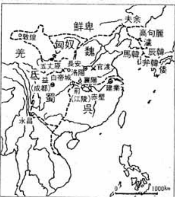
三国分立頃のアジア

後漢の朝廷では軍と宦官の対立が深まり、禁衛軍の袁紹、袁術は宦官2千名を誅殺。一方宦官誅滅を要請されて上洛した董卓は、首都洛陽と政府を制圧、宮殿を焼き、皇帝を傀儡とします。ために、袁紹は河北に、袁