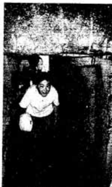
日拝塚古墳にて 史跡めぐり(平成5年)