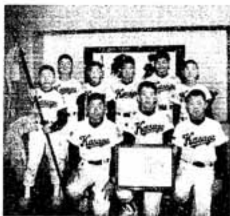
▲春日ビッグスタース小学部の皆さん