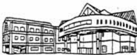
保健事業・デイサービス事業

目指すため、統括機能として、「春日市いきいきプラザ」を位置づけるとともに、それを支える庁内推進体制を整備します。