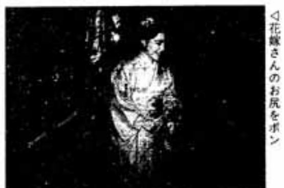
△花嫁さんのお尻をポン