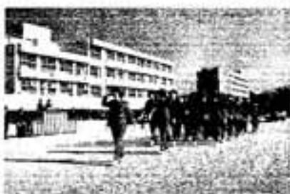
婦人消防隊員の分列行進

新春を迎え、毎年恒例の春日市・大野城市消防出初式が、1月9日に春日野中学校で行われました。式には、春日大野城消防署員、春日市・大野城市消防団員、春日地区婦人消防隊員が参加。観閲、展示訓練、表彰式などが、たくさんのお客を集め行われました。