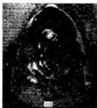
2千年前の弥生人骨―の谷出土

私たちは今日、諸岡川の流域、春日の丘いっばいに広がる神々たちの住居の跡、墓場を暴いて新しい町を造ってきました。祖先が遺してくれた美しい自然景