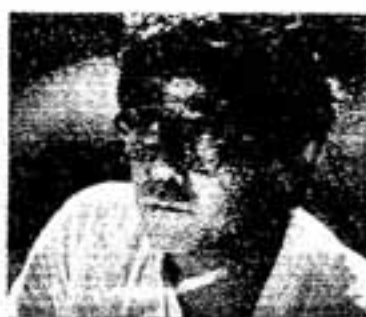
14代 酒井田柿右衛門氏

「美しさの原点は自然にあり」と、常に自然に教えを乞う姿勢を大切に、真摯な心で制作に励む酒井田柿右衛門先生に文化について語っていただきます。 このチャンスをお見逃しなく。 2月6日(日) 午後2時 午後3時30分(開場は、午後1時30分)