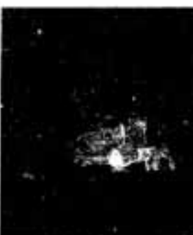
▲暗闇に浮び上がった人形

つどいでは、最初に虹の会の朗読や昔話があり、次いで福岡女学院短期大学生がハンドベルでクリスマスソングなどを演奏。最後に精華女子短期大学生に