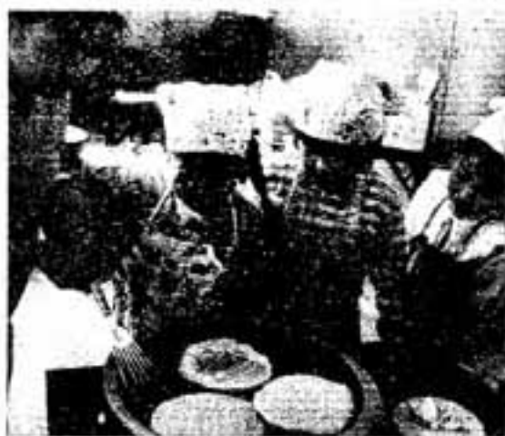
▲うまきひっくり返せるかな

12月11日(出)に、光町児童館で、小学生20人が参加した、デコレーション・ホットケーキづくりがありました。この催しはクリスマス前に、子どもたちにケーキづくりを体験させようとして、開かれたものです。