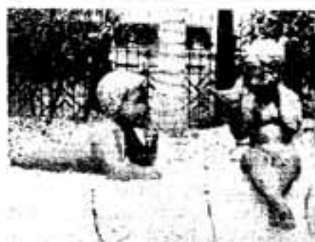
△「島と小島」(昇町親水公園)