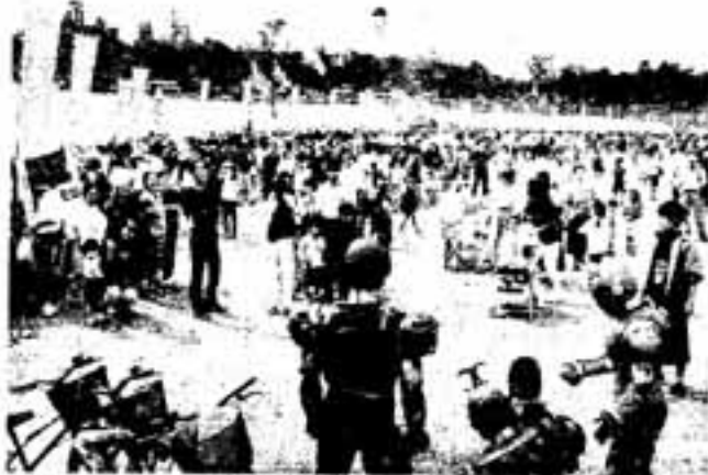
△重甲ビーファイターは人気者ノ

会場には雑貨、日用品などを売る市内の商店31店がテント張りの店を設営。さらにウサギ、ヒヨコ、ロバなどにふれて遊べる「ふれあい動物園」も開園、子どもたちを喜ばせました。