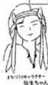
まろびけのうたがら 生立ちの人

総人口 99,378人 男 49,254人 女 50,124人 世帯数 36,356人世帯 (10月15日現在)