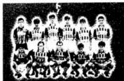
△福岡ブルックスの選手のみなさん