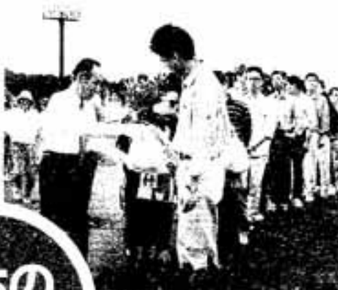
△緑を増やしてくださいね

西日本各地にも同様の行事が伝承されていますが、今回の指定は、「春日の婿押し」の内容が整った形で保存されていることが評価されたものです。