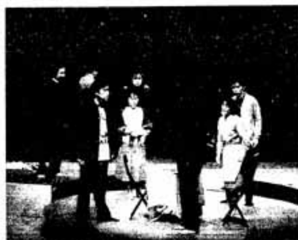
△スプリングホールで演じられる「エリアンの手記」