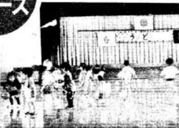
△われさきに風船を追いかける子どもたち