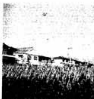
△現在の春日市(天神山付近)

て自作するしかなかった縄文時代の人々のライフスタイル(生活様式)からすれば、現代のライフスタイルは想像もつかない変ぼうぶりだと思えます。