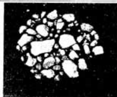
△縄文時代の石組炉(春日市出土)

縄文時代は、おおよそ草創期(約1万2千年前～約1万年前)早期(約1万年前～約6千年前)前期(約6千年前～約5千年前)中期(約5千年前～約4千年前)後期(約4千年前～約3千年前)晩期(約3千年前～約2千年前)