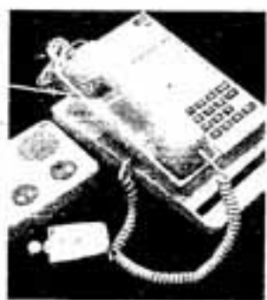
△緊急通報システム

ノーマライゼーションの理念の広がりのもと、駅舎のエレベーターの設置やリフトバスの運行など、障害者の利用を前提とした交通環境整備も徐々に進められており、今後より一層の