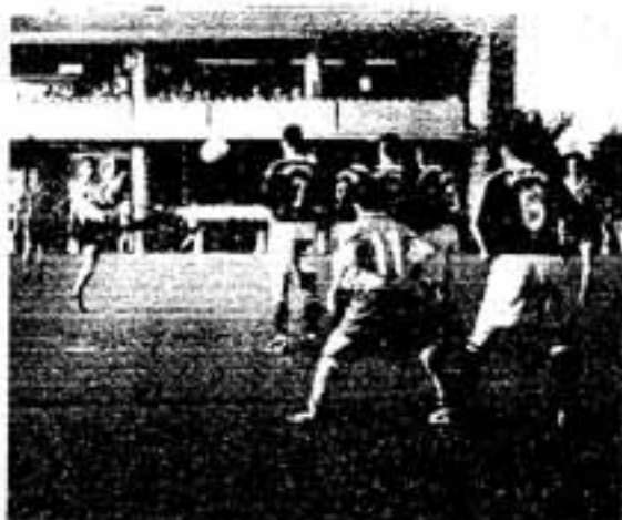
△フリーキック(白水大池公園多目的広場)