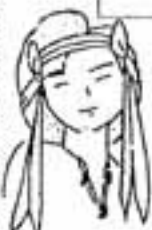
まろプロキョウクラー 保生ちのん