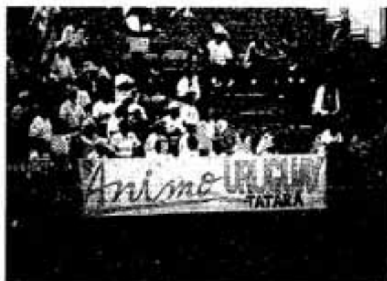
△福岡市民の応援団も観戦