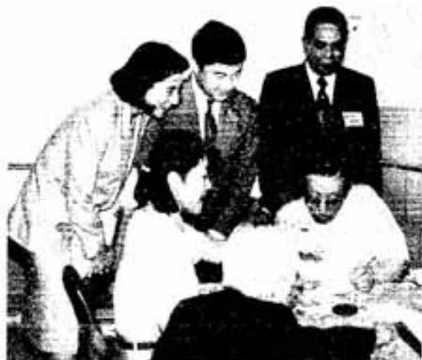
△優しく言葉をかけられる皇太子ご夫妻