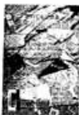
だれにでもできる最新草木の染色教室 夏編 廣子/著