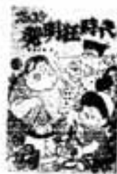
ズッコケ発明狂時代 藤須 正樹/著

三国志の曹操の子息にして純正の詩人・曹植の密かな愛と性のゆくえ。義姉・洛紀への秘めねばならなかった愛を、洛紀との出会いからその死に至るまでを中心に清新に描く。