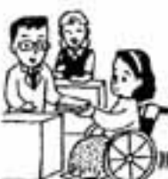
障害者雇用促進月間

事業主や、一般市民の皆さんのご理解とご協力により、1人でも多くの障害者の雇用の場の確保ができるようお願いいたします。