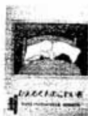
かえるくんのこわい夜 マックス・ベルジュイス / 文と絵

はじめて草木染めをする人にもわかりやすい基本的な染め方から、花びら染め、絞り染めなどいろいろな染め方を幅広く掲載。染め方をイラストを中心に詳細に解説。