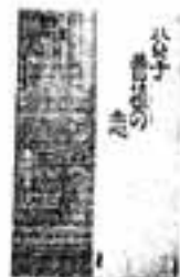
公子曹植の恋 水名子/著

三国志の曹操の子息にして純正の詩人・曹植の密かな愛と性のゆくえ。義姉・洛紀への秘めねばならなかった愛を、洛紀との出会いからその死に至るまでを中心に清新に描く。