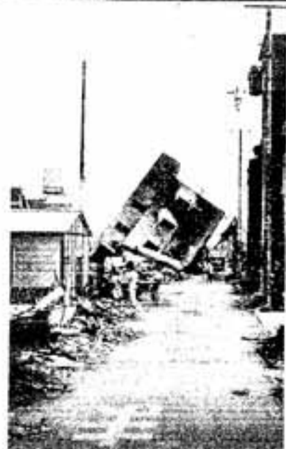
▲阪神・淡路大震災救助隊派遣記録写真

私たちは、「地震列島日本」に住んでいます。いつどこで地震が発生するかわかりません。地震がおきてもあわてずに落ち着いて行動ができるよう、次の点に注意しましょう。 ① 第1に身の安全をノ 地震を感じたらテーブルなどの下に隠れる。または手近の座布団・まくらなどで頭を保護し、身の安全を確保しま