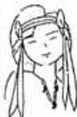
まろびのキョウコウター おんちやん