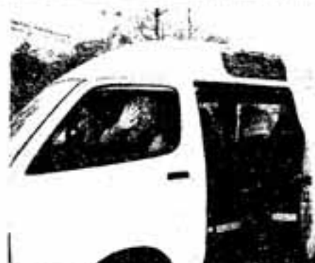
△バスの到着です。オハヨウ！