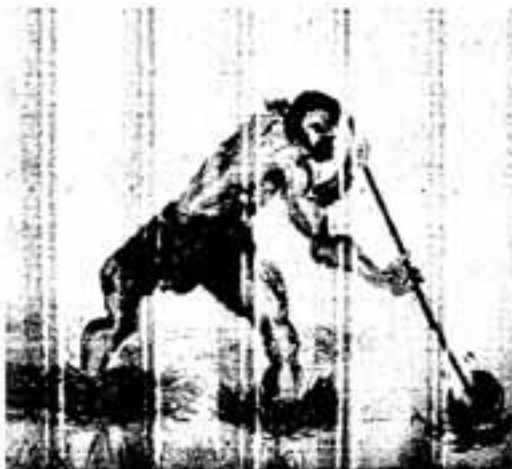
県立春日高校の美術部が制作した壁画

魚などをとっていたと思われまふ。このようにして、著しい環境の変化にも、人々は知恵を出しあつて巧みに対応し、新たな生活様式を生み出していったことと思ひます。