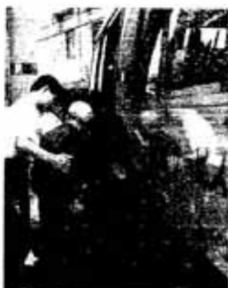
△次回までお元気で！

おばあちゃんも近所に友だちが 10年ほど前ここに来たせいで、 が、申し込んでよかったですね。 の人の勧めで申し込んだんです 知りました。民生委員や老人会 デイサービスのことは市報で