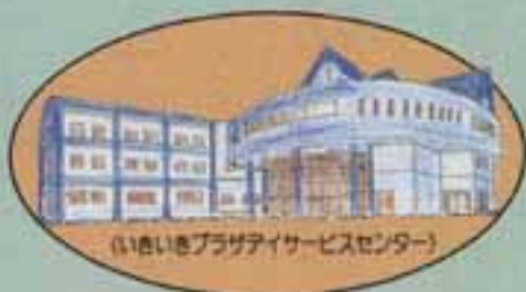
（いきいきプラザデイサービスセンター）

いきいきプラザのデイサービスセンターで行われているデイサービス（日帰り介護）。 「週に1度ここにくるのが待ち遠しくて」 「その日は、朝から心ウキウキ」 「今日は、やさしくて親切なセンターの職員の人や友だちといっしょに、話をしたり、ゲームをしたりして、たくさん笑って帰ります」 「ここにくるのが本当に楽しみなんです」 今回は、こんな会話が飛び交っていた春日市デイサービスセンターを紹介します。