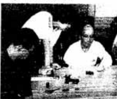
△食事のあとはゲームや絵描き