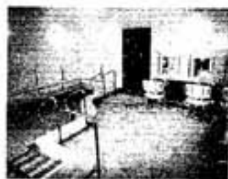
△こたしが浴場です