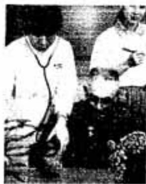
△今日の体調はいかが？