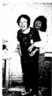
△笑顔がこぼれます