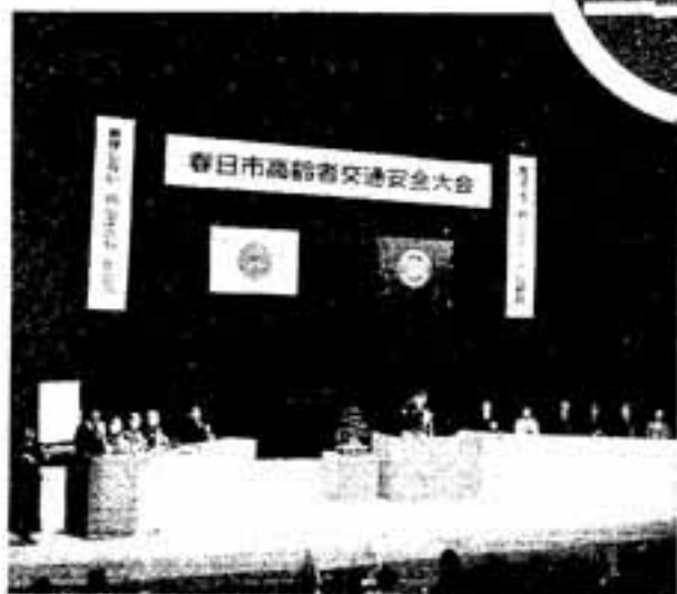
春日市高齢者交通安全大会