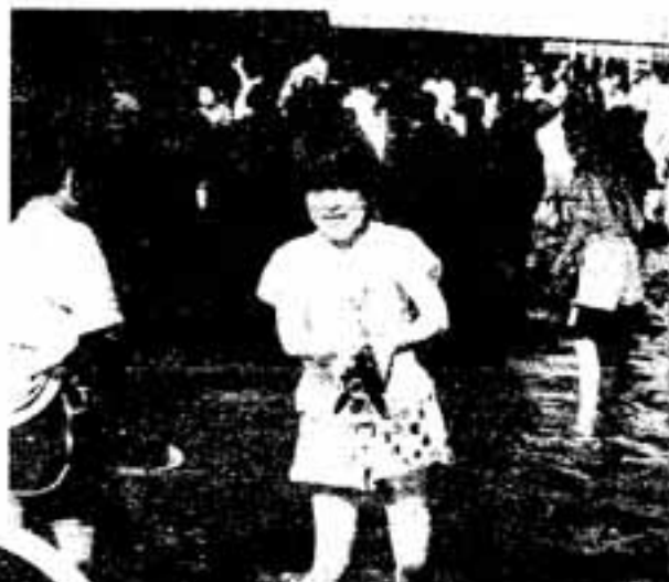
△見て/大きなコイをとっちゃった