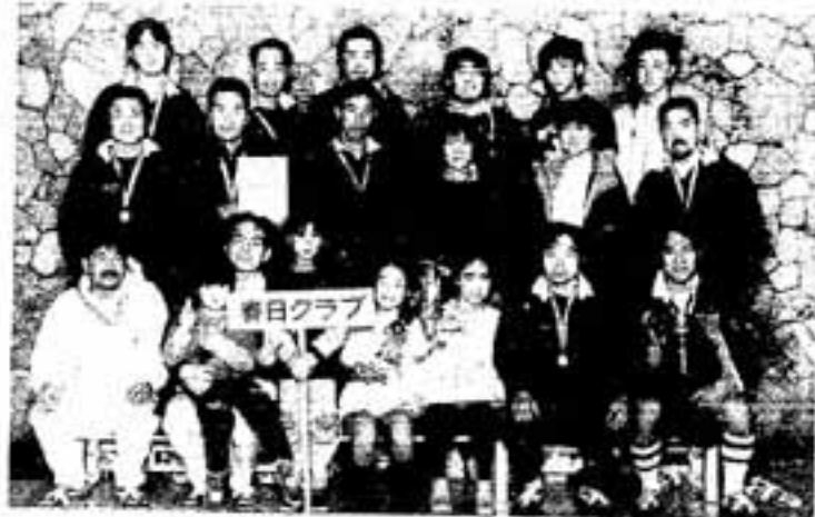
△全国制覇を果たした春日クラブの皆さん

春日クラブの全国大会出場は今回で連続5回目。平成3年の初出場ときは初戦で敗退、しかし全国大会出場を重ねるごとに実力をつけ、平成5年にはベスト8進出、翌平成6年には3位入賞を果た