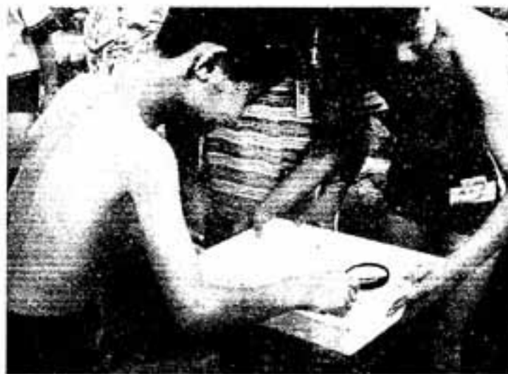
△これはヒラタカゲロウかな？

県の職員から川の観察や診断の方法などの説明があった後、「川のお医者さんになって、川を診断してください」という声で、子どもたちは一斉に川の中へ。