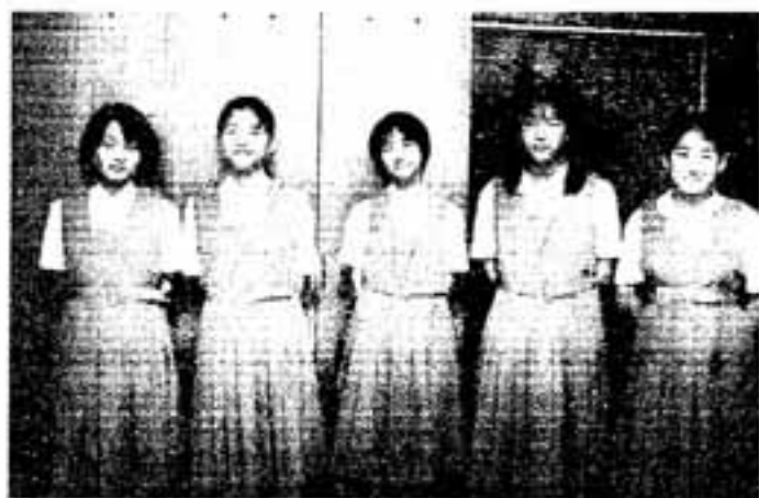
△ボランティア活動で表彰を受けた西中の仲良し5人組

春日西中学校の仲良し5人組が、平成7年4月から大野城市にある特別養護老人ホーム悠生園でボランティアを続けていることで、県警察署少年補導員連絡協議会などから善行表彰を受けました。