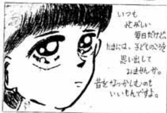
▲P・N もものかんづめ