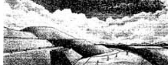
【巨大な築造物-前方後円墳】平原が前方部、中央の高くなった所が後円部 藤原寺古墳(筑紫保健所) 築造の五王の時代より (注:この古墳は5世紀の古墳です)

域の富を共同体ではなく 個人に集中させ、一般民 の墓と比べると格段の規 模で造られました。 古墳は地域の目立つと ころに築かれ、築造時に は現在のような樹木はなく、 墳丘全体は石で覆われるもの