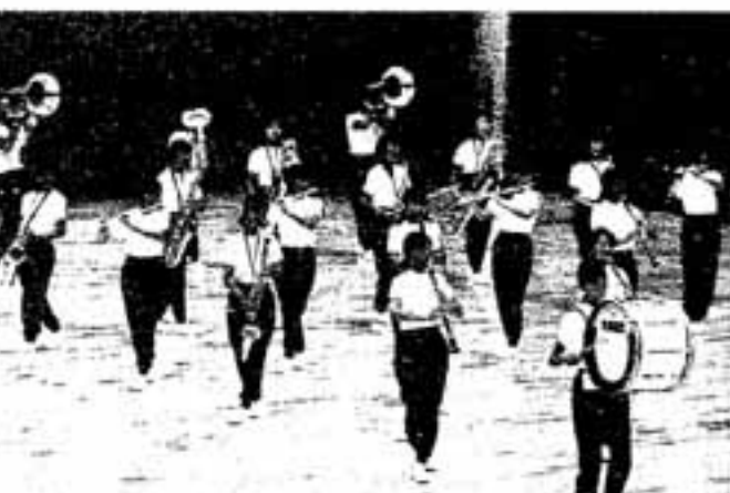
△熱演する春日東中吹奏楽部の皆さん

思うように引かず体勢が少しずつ崩れていきま 相手に引かせて、相手が悪れたところで一転勝負をかける。そのタイミングは相手の引く力が弱まり綱が緩む一瞬。攻勢に転じるこの瞬間は、綱を握る手でメンバー全員が感じとることができるところです。 春日クラブは、この戦法で昨年5月の環太平洋、昨年と今年2月の全日本、そして今回のアジア大会と、大舞台で次々と優勝を勝ち取ってきました。ディフェンスに重点を置いているとはいえ、相