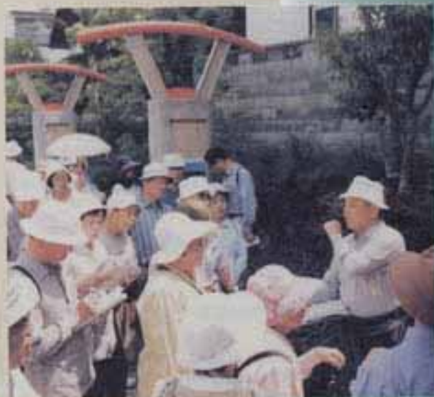
熱心に説明をする協会会長