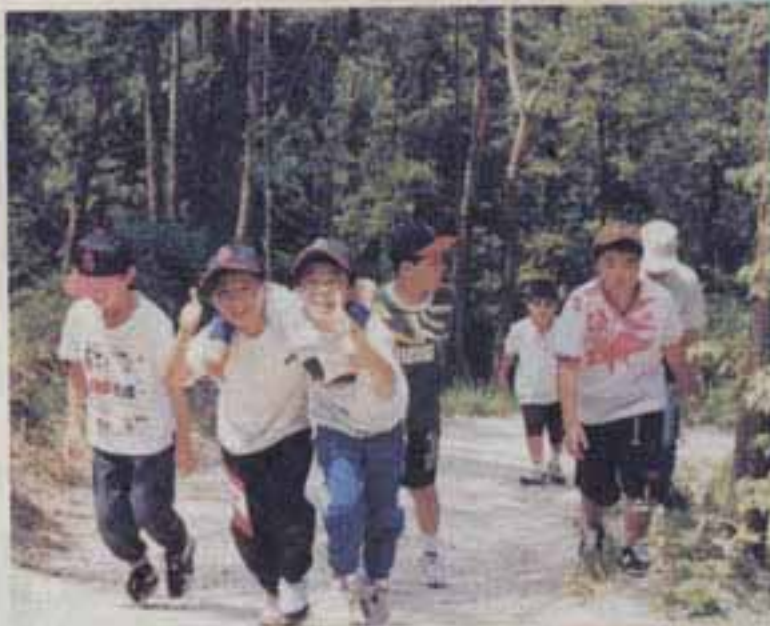
5月25日 野外活動場にて