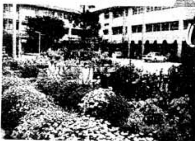
大谷小学校の見事な花壇

第18回花のコンクールの表彰式が、5月17日市役所で行われ、小学校の部で大谷小学校が、中学校の部で春日西中学校がそれぞれ最優秀賞を受賞しました。