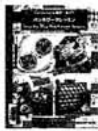
チワークレットス 藤田久美子/著

20年前に愛した男が、ヴァイオリンでバッハのカノンを演奏しながら自殺した…。幻聴のようにヴァイオリンの調べが響き、時間が交錯するホラー小説。