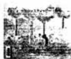
ヤンとステイッピー ベッツィー・バックス/著

開拓時代の女性たちによって作られたパッチワークは、アメリカの生活文化史そのもの。四角形や六角形など、形に合わせてデザインした作品と作り方のポイントを紹介。<型紙付き>