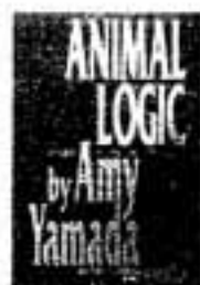
アニマル・ロジック 山田詠美/著

駅員のヤンはおどりが大好き。ひまさえあればいつでもおどっていましたが、他の駅員たちからはけむたがられていました。ところがある日、捨て犬のステイッピーと出会って…。