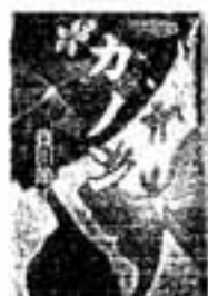
カノン 藤田節子/著

20年前に愛した男が、ヴァイオリンでバッハのカノンを演奏しながら自殺した…。幻聴のようにヴァイオリンの調べが響き、時間が交錯するホラー小説。