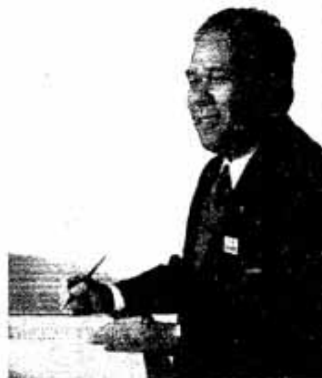
春日市長 白水 清幸

本年、私は市長就任以来10年の節目を迎えます。十年一昔と言いますが、昨今の変化の激しさは、この表現ではもどかしさを感じるほどの早さになっていきます。