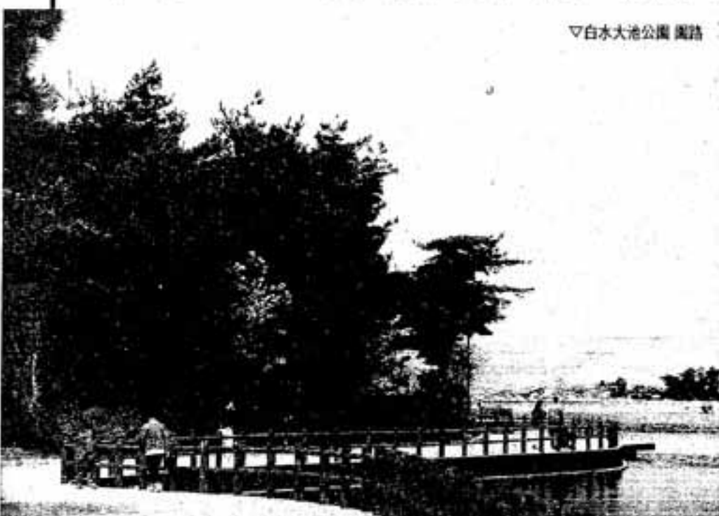
▽白水大池公園 園路

このため、行財政改革の審議をお願いしております。春日市行政改革推進委員会から答申をいただきましたので、これらを踏まえ、今後とも行財政の効率化を目指し積極的に取り組んでまいります。