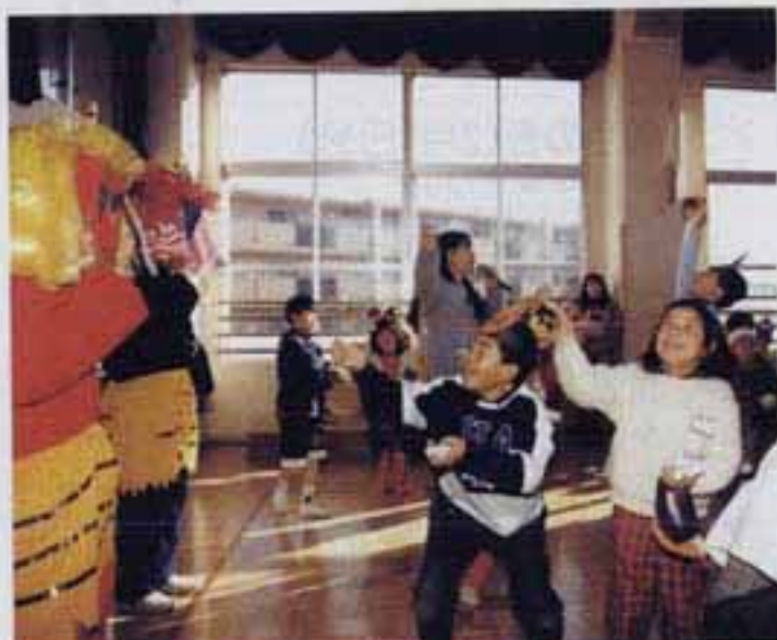
△元気に豆まきする子どもたち

1月27日、光町児童館で、子どもたち約20人が参加して、おりがみ教室が開かれました。 教室では、案内先生が自分で折った「リス」「コウモリ」「ベガサス」などを分けて折った鳥や蛙が動くのが見せながら、「折り紙のおもしろかった」と楽しそうに話していました。 その後、「はばたく鳥」「バク」「ひこうき」などをみんなで作りました。 最後に、先生が折った作品を賞品に、ひこうき機は大会をしました。 参加した子どもたちは、「自分」