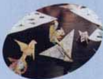
〈おりがみ動物園完成