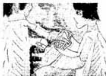
審査委員特別賞(赤星信子賞) 園田 薫

大賞展には、5,548点の応募があり、その中から入賞作品33点、入選作品266点が決まりました。弥生の里大賞に選ばれた森高千尋ちゃんら入賞者に、賞状と記念品が贈られました。