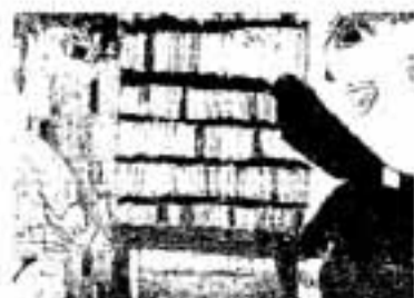
春日市教育長賞 奥山 樹