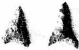
△白水池から出土した石鏃

今から20年ほど前まで、市 内のあちらの造成地、こちら の崖面に弥生土器が散見し、 私が案内した関西からの見学 者を「さすが春日」とうなら せたものでした。しかし、縄 文土器を目にしたたり、拾った