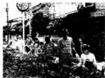
(市生活環境組合連合会)

クリーン作戦は、毎年春と秋の2回、第3日曜日(家庭の日)に行われます。空き缶、空きビンを拾うことで「ポイ捨て防止」など市民一人ひとりのマナーアップと、ゴミのないまちづくりを目指しています。回収された空き缶、空きビンは、大切な資源としてリサイクルされます。 今回は、11月16日(日)に各区長を中心として、一斉に行われます。 美しいまちをつくるために、家族そろってクリーン作戦に参加しましょう。