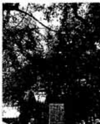
アラカシに寄生したオオバヤドリギ(岡本熊野神社)

このように縁起のいいロマンチックな樹木ではあるのですが、実際に困ったこともあります。