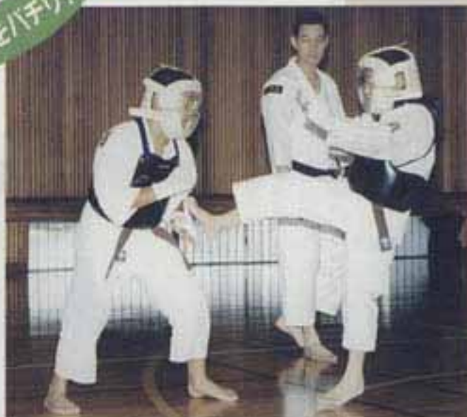
△9月28日 少林寺拳法練成大会