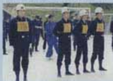
△優勝した北分団チーム

当日は、4市1町から5チームが出場。火災を想定した一連の消火作業を、いかに早く、そして的確に行うかを競いました。