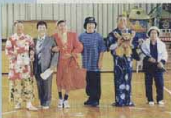
△一体私は誰でしょう

着飾ったモデルたちに、会場からは「よく似合う」などといった声が上がっていました。