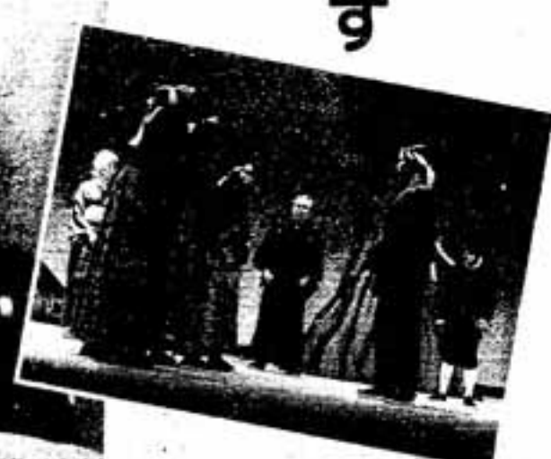
写真は去年上演されたものです