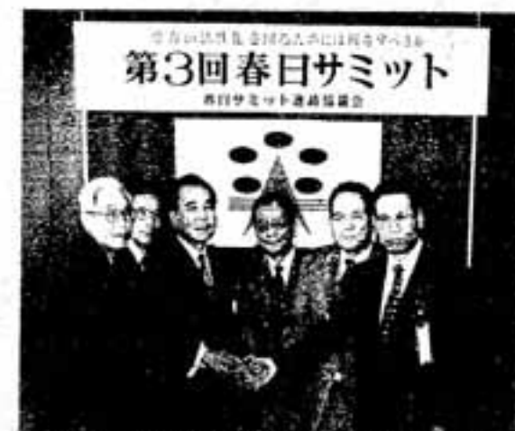
六つの「春日」がしっかり握手