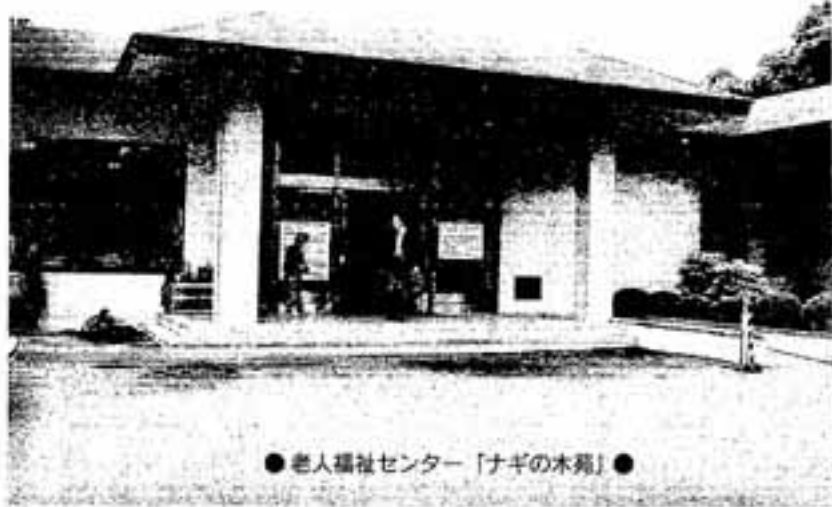
●老人福祉センター「ナギの木苑」●