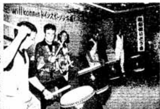
ドイツのスポーツ少年団と春日市太鼓に挑戦するドイツ少年団