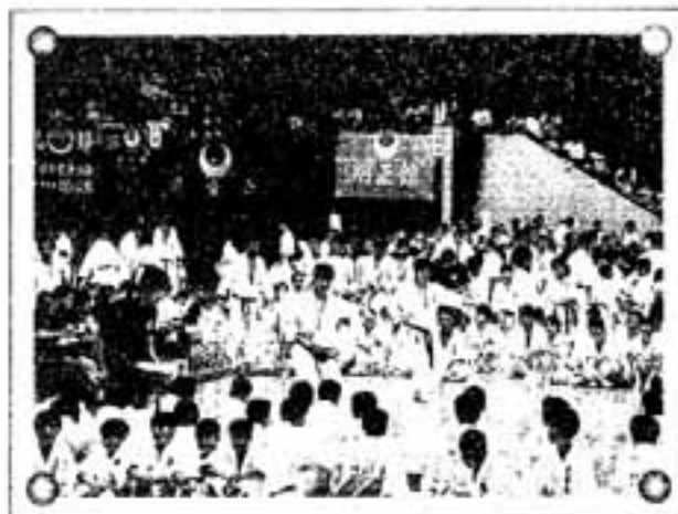
△高校生・形の部で熱演する春日市の選手