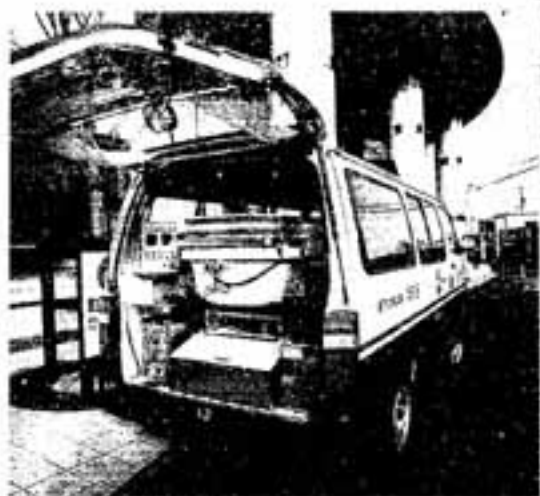
●訪問入浴サービス●