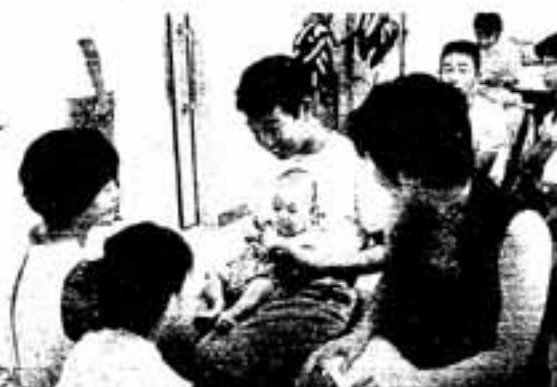
▷保健婦に教わり、赤ちゃんを抱っこする中学生

8月8日、いきいきプラザで、春日北中学校1年生の男女19人が参加して、4か月健診を受けに来た赤ちゃんとのふれあい体験学習が行われました。 この学習は、思春期に乳幼児に接することで、生命の尊さを学び、母性や父性を健全に育むことを目的としたもので、今年で2回目。 生徒たちは、まず赤ちゃんの成長や発達について講義を受けたあと、実際に健診のお手伝い。最初はおっかなびっくり。緊張しているせいか抱き方もぎこちない様子でしたが、慣れるにつれて楽しく赤ちゃんときんぐり。 「抱っこしたとき、腕の中に命があるのが不思議でドキドキした」と、じかに赤ちゃんに触れたことで命の大切さを実感したようでした。